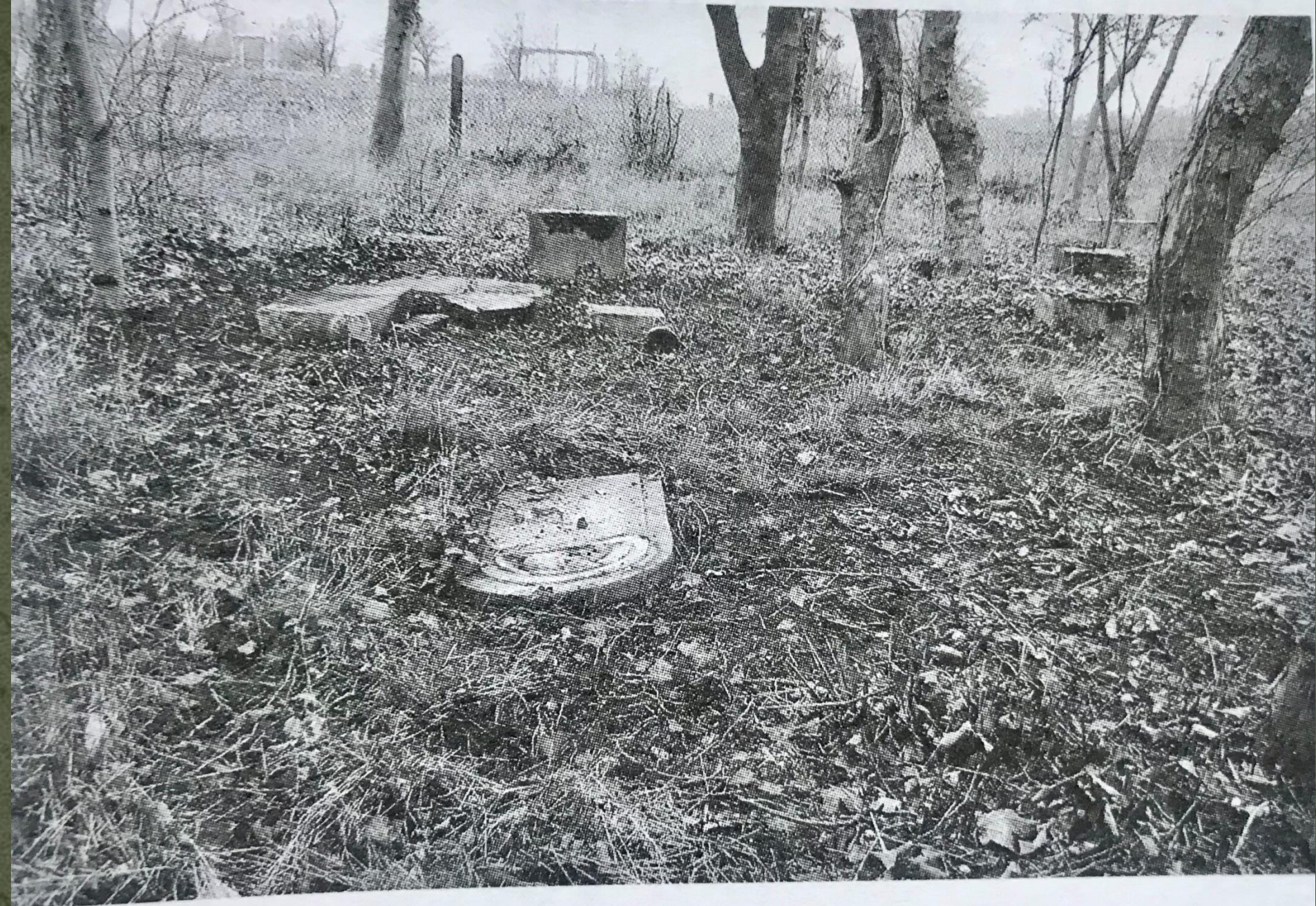
Stan początkowy cmentarza