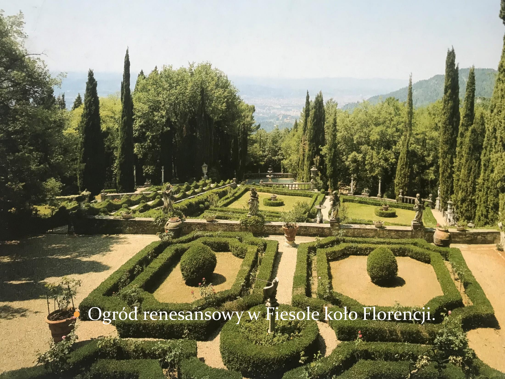
• Ogród renesansowy w Fiesole koło Florencji.