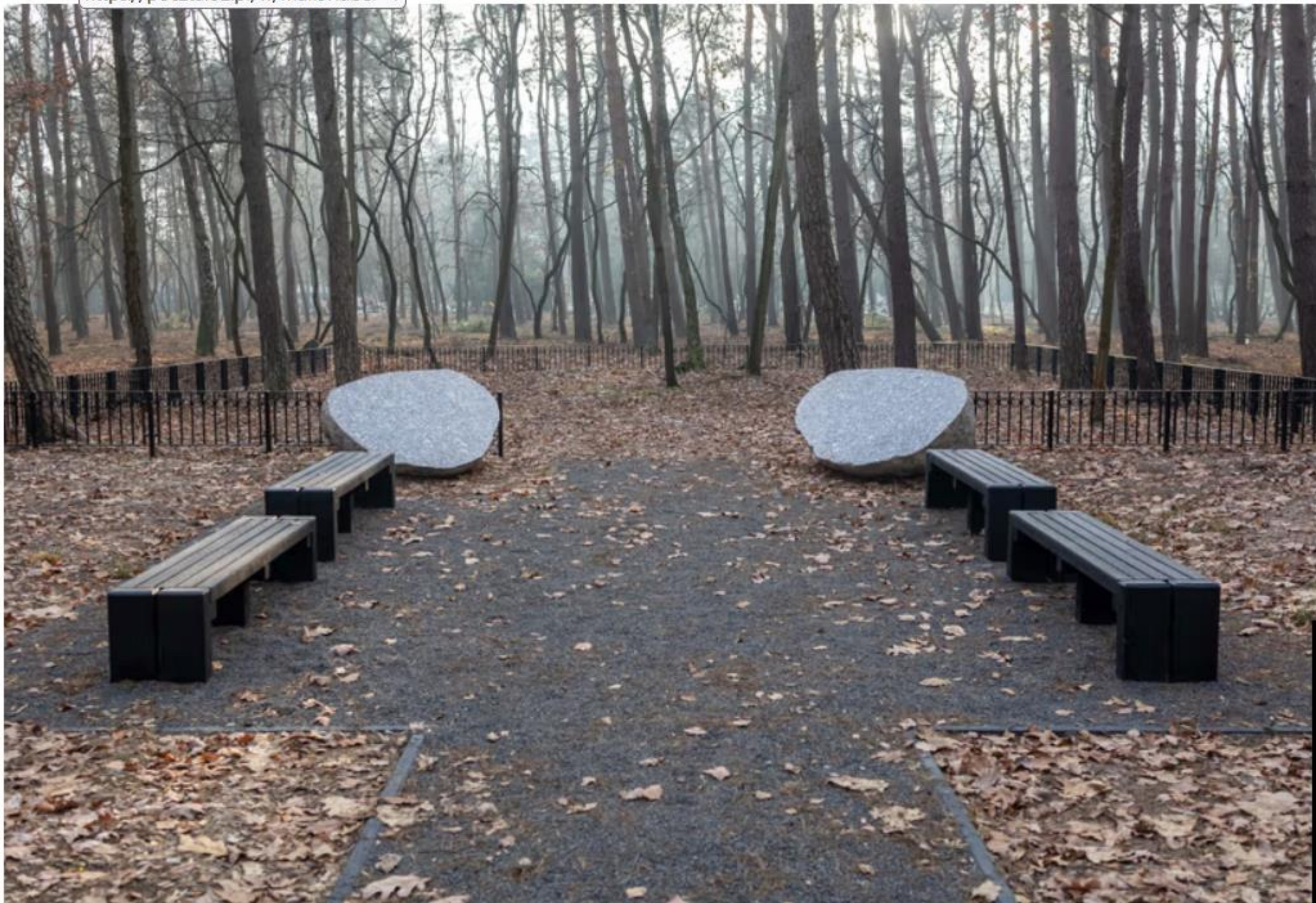
Las Pamięci to miejsce zbiorowego pochówku.