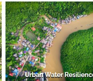
Urban Water Resilience