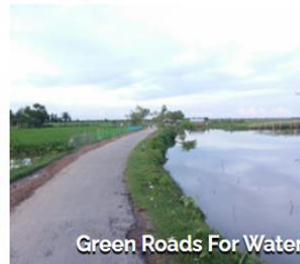
Green Roads For Water